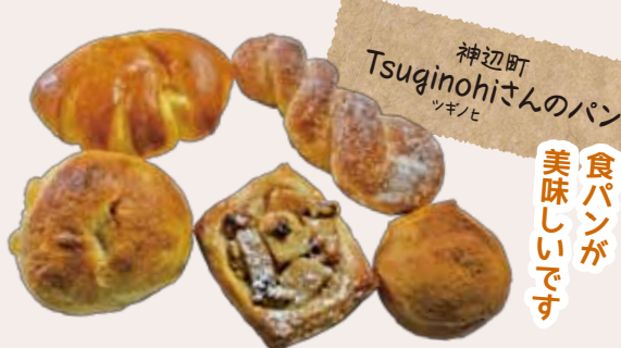
神辺町 Tsuginohiさんのパン

理想は整理収納が常に保たれているシンプルな空間ですが、いろいろなモノ増え続け片づけが追いつかずため息が出る日々です。