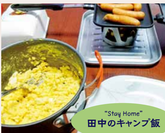
“Stay Home” 田中のキャンプ飯

元々料理は全くできないので当然味覚にも自信はなく、近くのスーパーで購入した食材をそれなりにアレンジしておりました。ありきたりのメニューに飽きてきたので、思い切って変わった食材を使ってみようと思いつき、写真にある餃子アヒージョを試してみました。ただの油っこい餃子でした…。次にナポリタンとチーズを挟んだホットサンドを作りました。炭水化物+炭水化物でカロリーが気になって味がわかりませんでした。結局ウインナーと卵サラダが一番おいしいことに気が付くんですが、私がマヨネーズ嫌いなので、パサパサな卵サラダになってしまい…。どうやら料理は向いていないみたいです…。